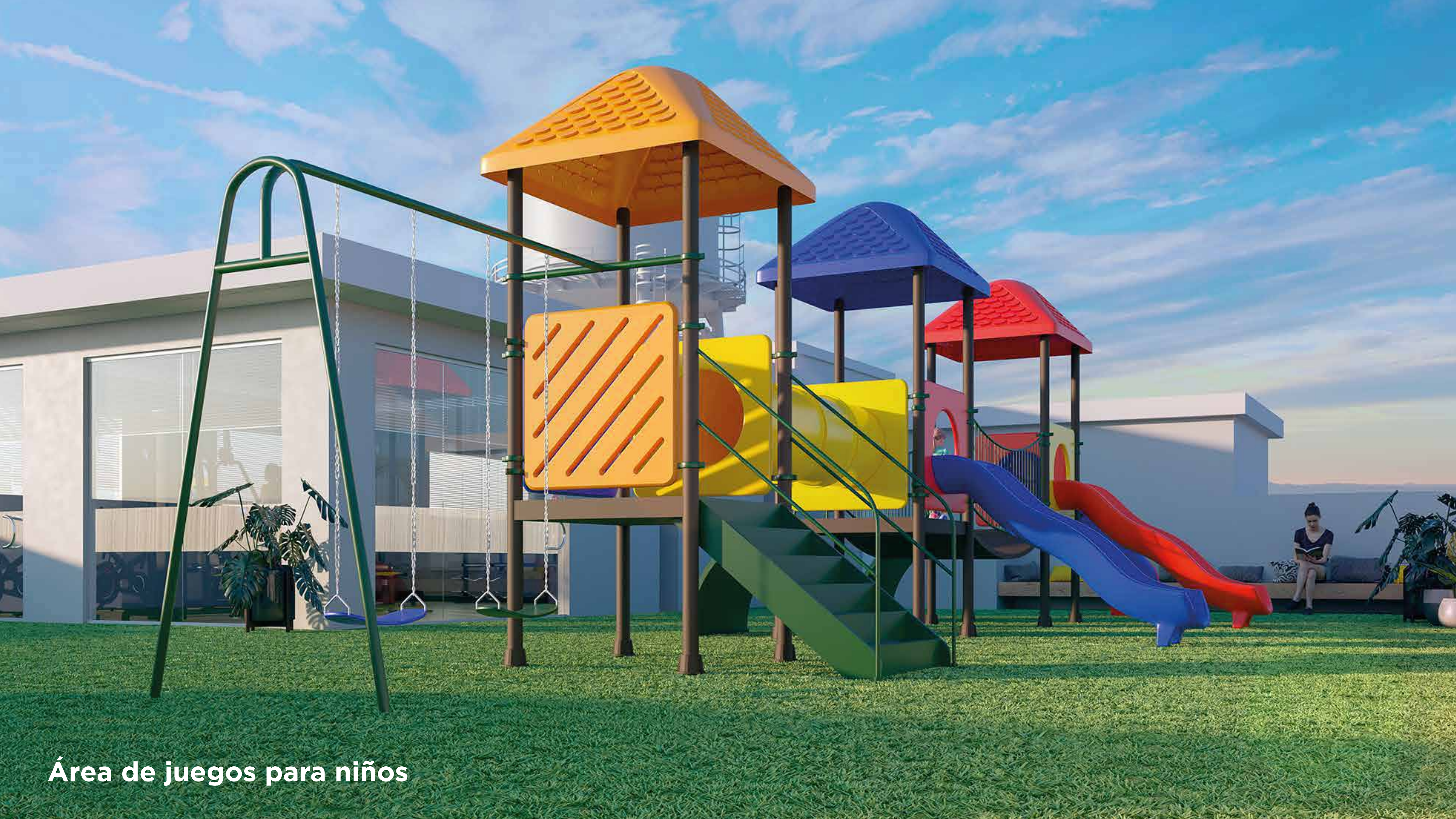
Área de juegos para niños