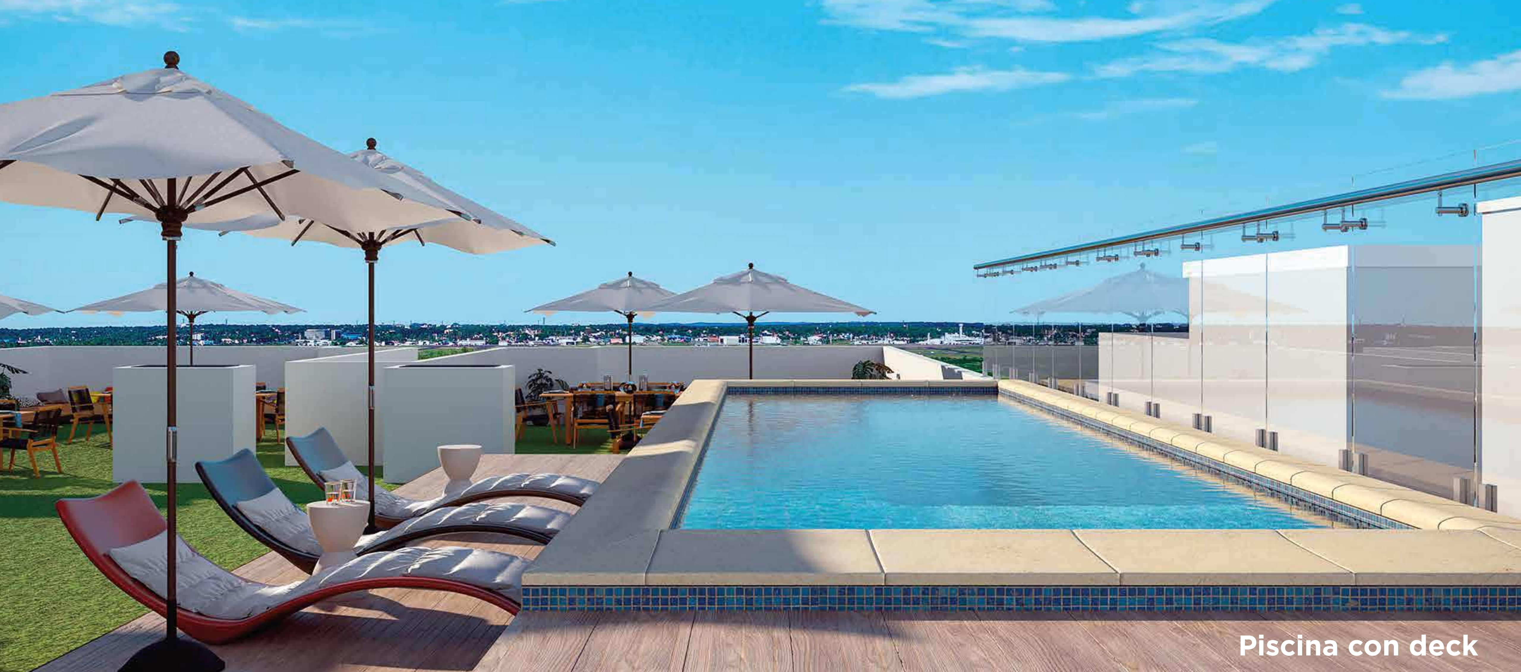
Piscina con deck